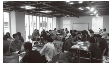
▲日语学习班的状态